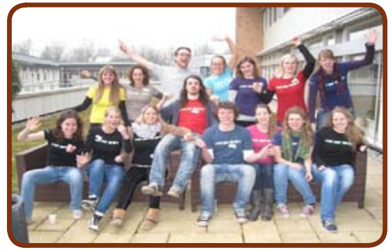
Groepsfoto van Het Pantarijn, Wageningen

De lente is begonnen en dat hebben we gemerkt met de hoge temperaturen van de afgelopen weken. Nederland was zelfs even het warmste plekje in Europa; mazzel of de gevolgen van klimaatverandering? Precies in die warme weken was het topdrukte bij Cross Your Borders. In week 17 was CYB een dag met 84 vrijwilligers en stagiaires op stap, een record! Duidelijk dus dat CYB een enorme groei heeft doorgemaakt. Niet alleen in Nederland trouwens. Ook in het buitenland zijn CYB-shirtjes te spotten... In deze nieuwsbrief kun je nog meer lezen over de ontwikkeling in het afgelopen jaar en over de CYBers in het buitenland!