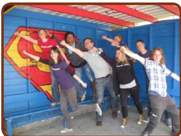
Deze Super-CYBers zorgen ervoor dat ieder project een daverend succes wordt.

De leukste, zonnigste, grappigste, gekste teamfoto wint een plekje in de nieuwsbrief, op de site en op Facebook! Dus laat je van je creatiefste kant zien!